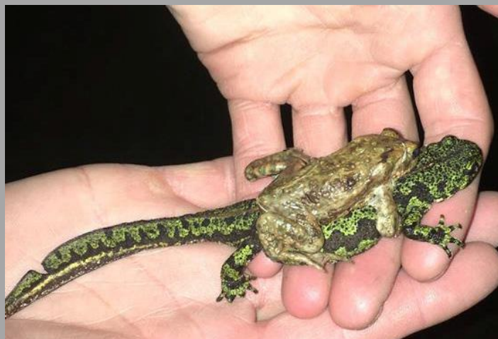
Foto: amplexus van gewone pad en marmersalamander in de Stationsstraat in Lochristi (Lars Mareen)